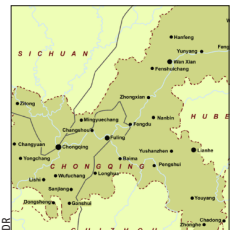
Chongqing est la plus grande ville du Sud-Ouest de la Chine : 3,2 millions d'habitants, mais plus de 30 millions pour l'agglomération.