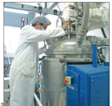
Les laboratoires Lebeau (82) développent une gamme de soins adaptés aux peaux asiatiques.

prend 19 produits : des soins éclaircisants, des crèmes peaux grasses avec des molécules anti-inflammatoires apaisantes ou encore des produits destinés à réduire les poches sous les yeux. « Nous partons à la conquête d'un marché colossal », explique Le Dr Pierre Huet, associé au projet. « 150 K€ ont été investis et nous allons participer au prochain salon Cosmo Prof qui va se tenir à Hong-Kong ».