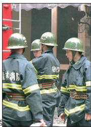
La sécurité civile chinoise.

Pas moins de 8 personnes du groupement d'entreprises Cecile, spécialisées dans la navigation par satellite, seront du voyage à Chongqing. Depuis juillet et la visite en France du directeur général du Bureau de la prévention contre l'incendie de la ville chinoise, les contacts se sont intensifiés.